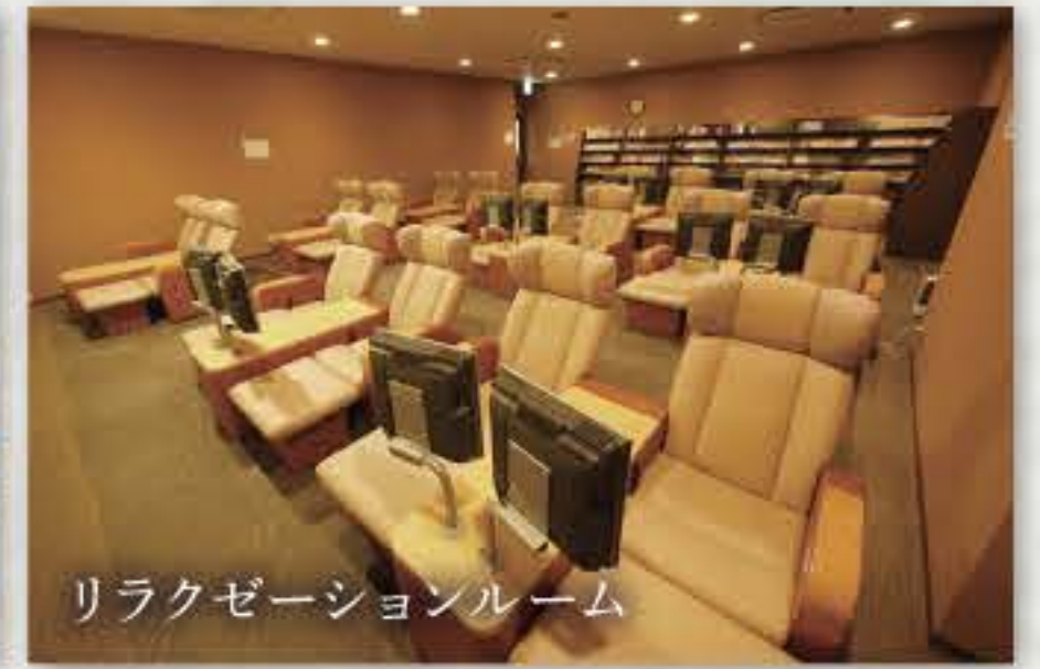
リラクゼーションルーム

【入館料】大人 800円 / 小学生 500円 / 3歳~小学生未満 300円 (土日祝は+100円・3歳以下は入館無料)