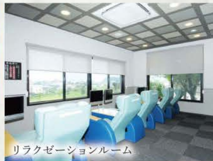
リラクゼーションルーム