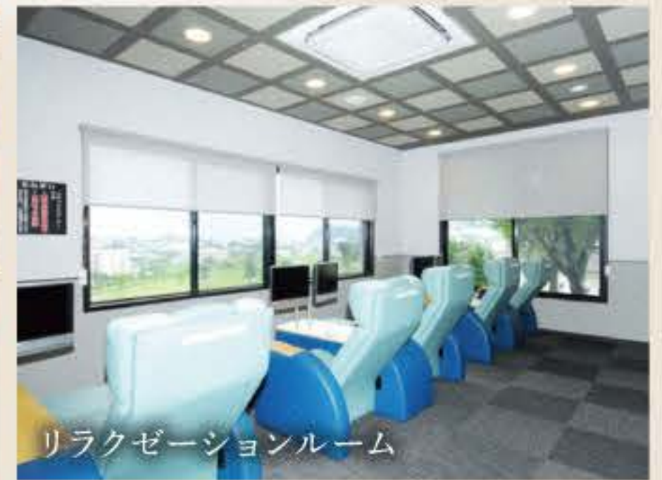
リラクゼーションルーム